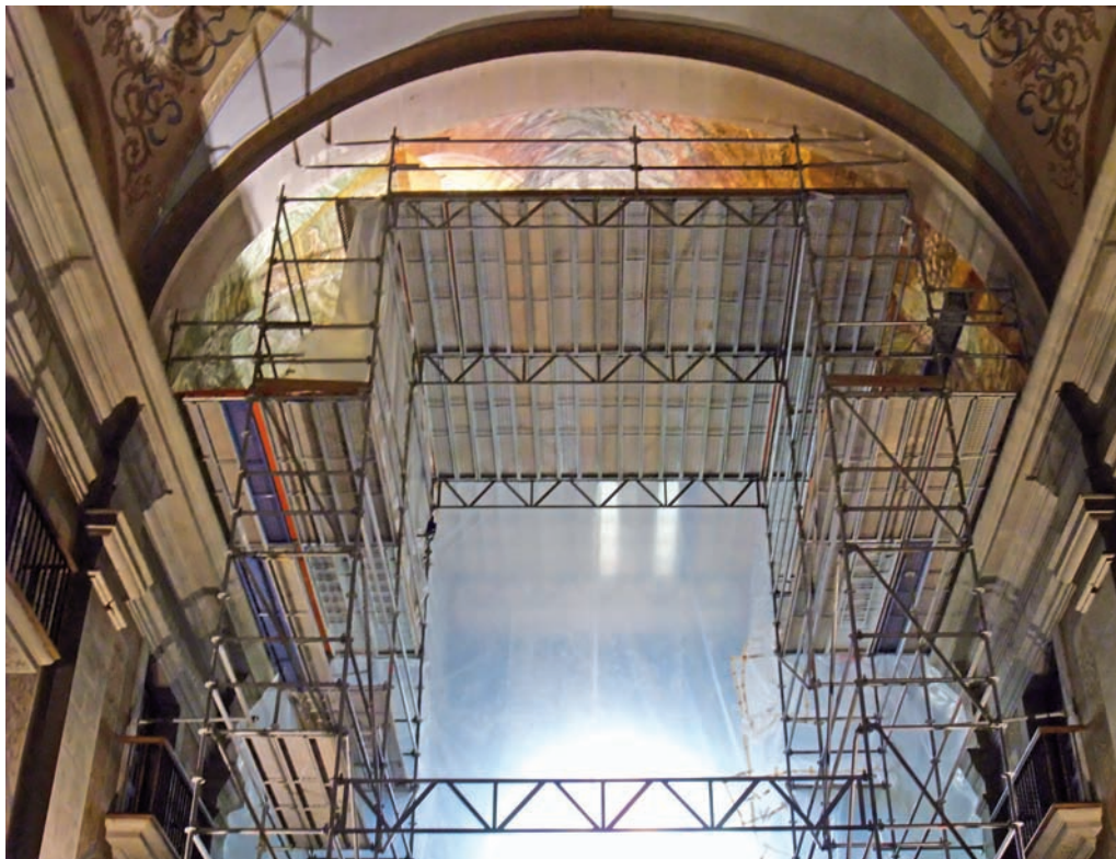
Bastida de les voltes de la nau de Santa Maria de l'Alba. Tàrrega, 2009.

superfícies murals, adaptar-los al pla pictòric i superar les distorsions òptiques aplicant la tàctica adequada.